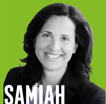
SAMIAH EL SAMADONI

ist Bürgerbeauftragte für soziale Angelegenheiten des Landes Schleswig-Holstein, Juristin und zertifizierte Mediatorin.